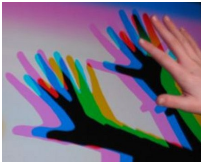
Illustrazione 2: mani e ombre colorate

Parliamo quindi delle ombre colorate, su cui ragionano Lucilla Ruffilli e Anna D'Attilia. Chi segue questa rubrica può facilmente capire perché l'articolo mi abbia interessato: tocca infatti il problema della percezione dei colori, che mi è accaduto di sfiorare qualche tempo fa. L'inizio dell'articolo mostra però subito che l'interesse delle autrici è più vasto: siamo in un campo che non saprei neppure ben definire, se non vagamente come psicologia cognitiva.